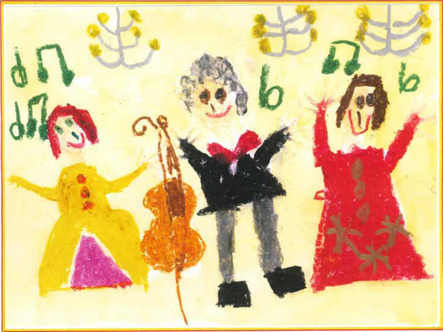
Ein Fest im Schloss Ludwig van Beethoven war das jüngste Mitglied des Hoforchesters